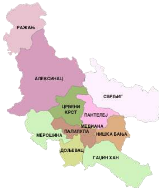
Слика 2 - Општине Нишавског округа