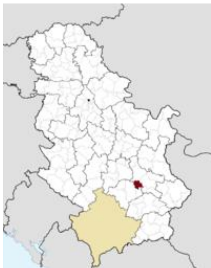
Слика 1 - Карта РС са општином Мeroшина обележеном црвеном бојом